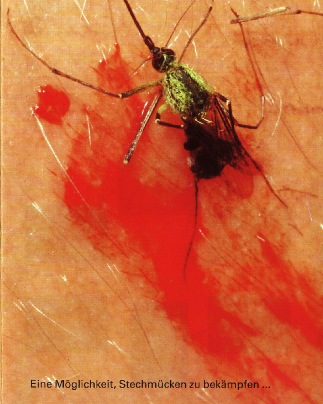
Eine Möglichkeit, Stechmücken zu bekämpfen ...

Kommunale Aktionsgemeinschaft zur Bekämpfung der Schnakenplage e.V. Ludwigshafen am Rhein